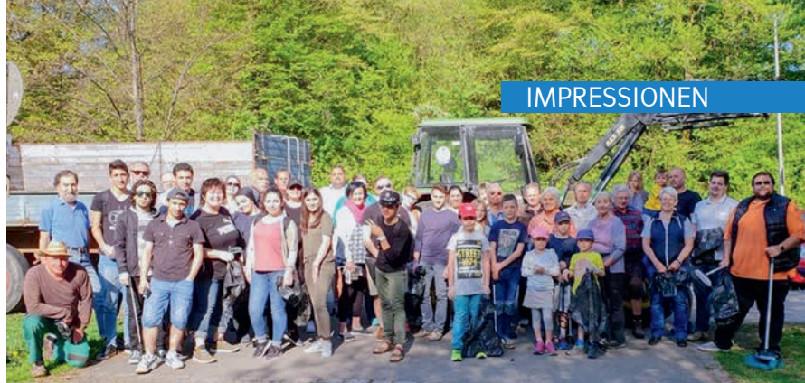
Unser Rama Dama 2018! Rekordbeteiligung an Helferinnen und Helfern. Mit dabei die Junge Union und der Helferkreis Asyl mit 3 Helfern und über 10 Flüchtlingen aus Syrien