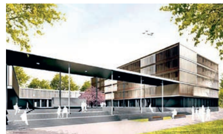
Die FOS / BOS kommt nach Unterschleißheim

Infrastruktur wie Waldfriedhof mit musterhaft pietätvoller Aussegnungshalle, Erweitern von Rathaus, Bibliothek und Feuerwehrhaus, Modernisierung von Wasserversorgung und Abwasserbeseitigung, das Eingliedern des Stadtteils Hollern aus der Gemeinde Eching und dessen weiteres Entwickeln sowie das planerisch geordnete Bauen im Stadtteil Riedmoos.