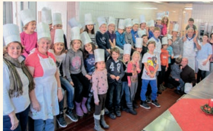
2012 Kochen mit Landrat Christoph Göbel