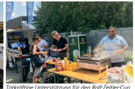
Tatkräftige Unterstützung für den Rolf-Zeitler-Cup