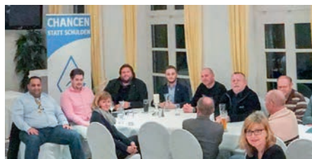
Kommunalpolitischer Arbeitskreis: Zukunftsthemen werden diskutiert und verdichtet