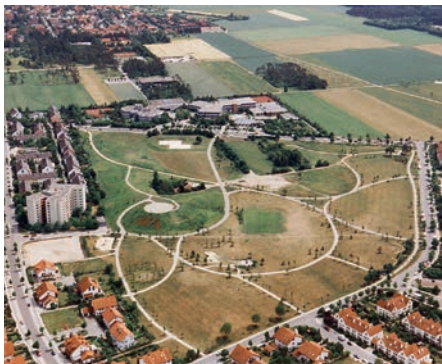
Luftbild mit Realschule und Gymnasium

des BallhausForums als regionales Kultur-, Sport- und Veranstaltungszentrum mit angeschlossenen privatem Hotel sowie als Daueraufgabe das intensive Weiterentwickeln des Wirtschaftsstandortes Unterschleißheim mit dem ICU e.V. und Wirtschaftskontakten nach Russland und China.