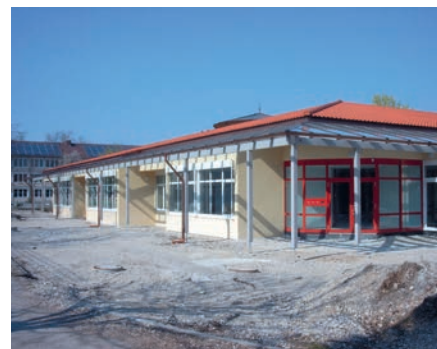
2000: Das erste Kinderhaus, noch ehe es sie in der bayerischen Kindertagesstättenpolitik gab