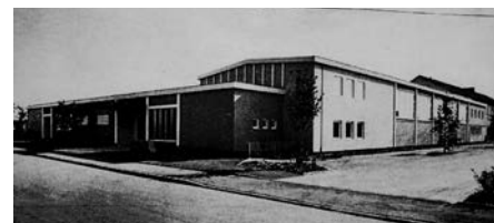
Bau der Mehrzweckhalle

1972 wurde er mit der Verleihung der Bürgermedaille in Gold geehrt, zu seinem 90. Geburtstag ernannte ihn der Gemeinderat zum ersten Ehrenbürger von Unterschleißheim.