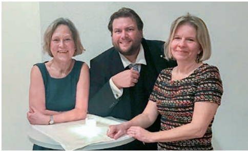
1.000 € Spende von unserem Weihnachts-Eintopf zur Renovierung des Mallertshofener Kircherls