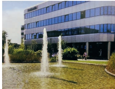
Anfang der 90er-Jahre: Ansiedlung der Microsoft Deutschlandzentrale: weniger Industrie, mehr High Tech