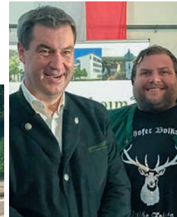
Unser Ministerpräsident Dr. Markus Söder findet lobende Worte für das „Wuide Zeiten“-Shirt vom Lohhofer Volksfest