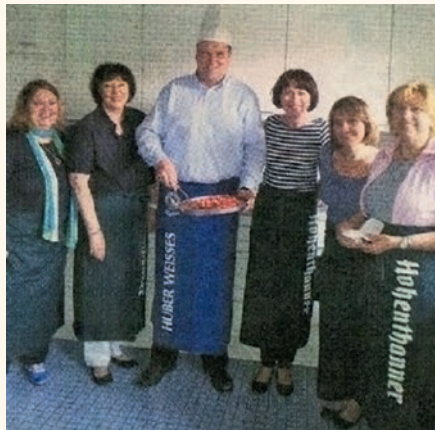
2012 Kochen mit Landrat Christoph Göbel