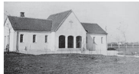
Das seit 1937 geplante aber erst 1946 erbaute Leichenhaus am Lohhofer Friedhof