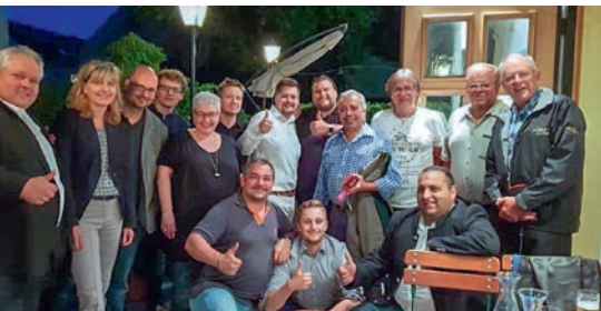
Der Politische Stammtisch am ersten Freitag eines jeden Monats im Alten Wirt erfreut sich immer größerer Beliebtheit