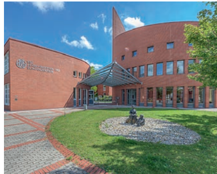
Das Sehbehindertenzentrum wird zum Förderzentrum des Bezirks Oberbayern